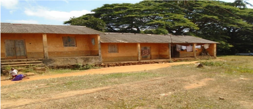
Mojawapo ya nyumba zinazotumiwa na askari na familia zao kwa makaazi katika kambi za idara ya chuo cha mafunzo