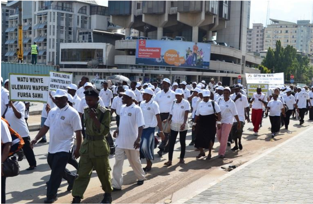
Maandamano ni miongoni mwa shughuli zinazofanywa kila mwaka wakati wa maadhimisho ya Siku ya haki za binadamu duniani. Pichani ni waandamanaji, baadhi yao wakiwa na mabango yenye jumbe mbalimbali wakipita katika mitaa ya jiji la Dar es Salaam wakielekea viwanja vya Mnazi Mmoja Desemba 10, 2013.