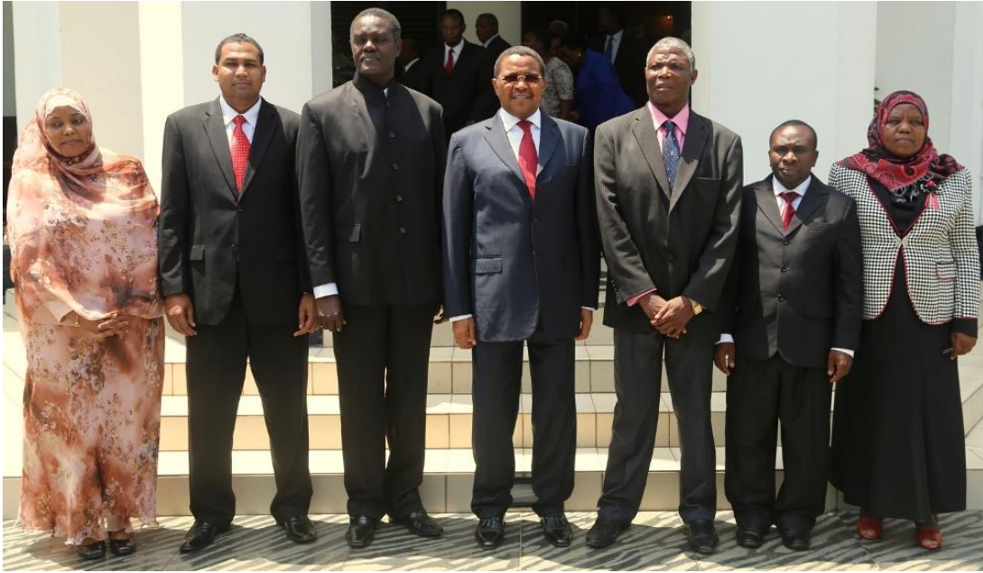
Uongozi mpya wa Awamu ya Tatu ya THBUB ukiwa katika picha ya pamoja na Mhe. Rais waa Jamhuri ya Muungano wa Tanzania wa Awamu ya Nne Mhe. Dr Jakaya Mrisho Kikwete mara baada ya kuapishwa Ikulu Jijini Dar es Salaam tarehe 7 Januari 2015.