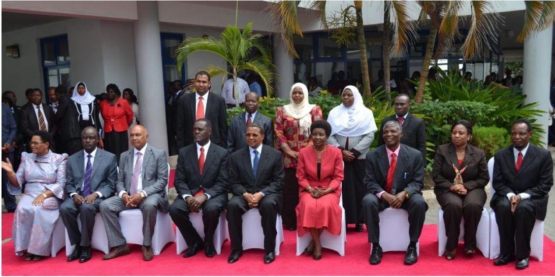
Aliyekuwa Rais wa Awamu ya nne ya Jamhuri ya Muungano wa Tanzania Mhe. Dkt Jakaya Mrisho Kikwete (wa tano kulia) akiwa katika picha ya pamoja na Viongozi wa Serikali na Makamishna wa THBUB alipotembelea Ofisi za THBUB mwaka 2015.