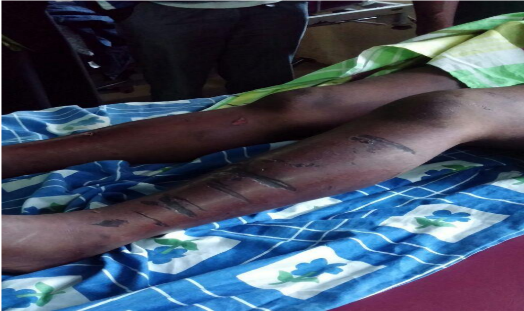
Miguu ya mmoja wa vijana waliopigwa na kujeruhiwa na watu waliotambulika kama Polisi Jamii tarehe 3 Januari, 2017 katika Shehia ya Chuini, Wilaya ya Magharibi A.