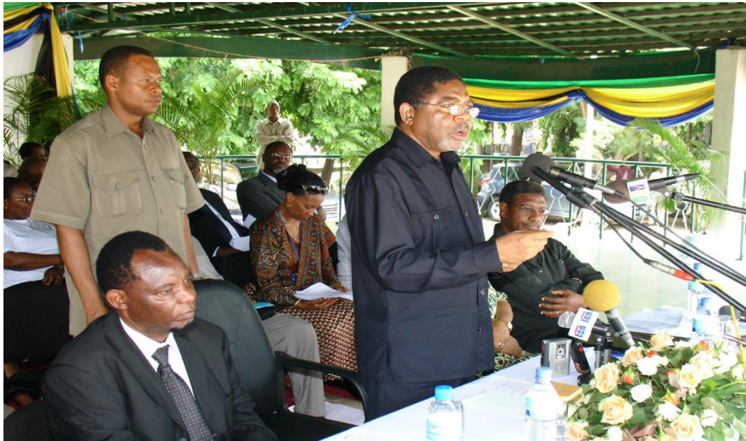
Aliyekuwa Makamu wa Rais wa Jamhuri ya Muungano wa Tanzania Mhe. Dk. Mohamed Ali Shein akihutubia taifa siku ya maadhimisho ya Miaka sitini ya tamko la haki za binadamu tarehe 10 Disemba 2008